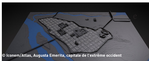
Augusta Emerita, capitale de l'extrême occident

Retour d'expérience d'une approche méthodologique innovante : l'exposition "Villes invisibles"